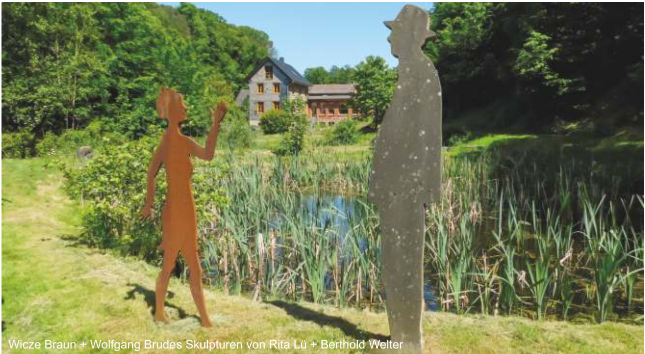
Wicze Braun + Wolfgang Brudes Skulpturen von Rita Lü + Berthold Welter