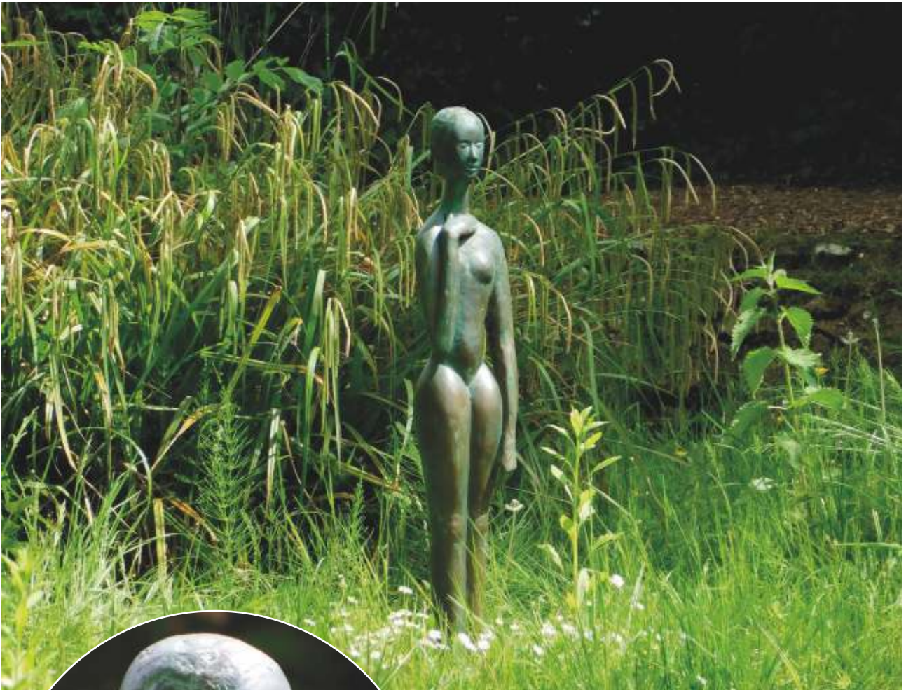
Bronze 1,10 m hoch