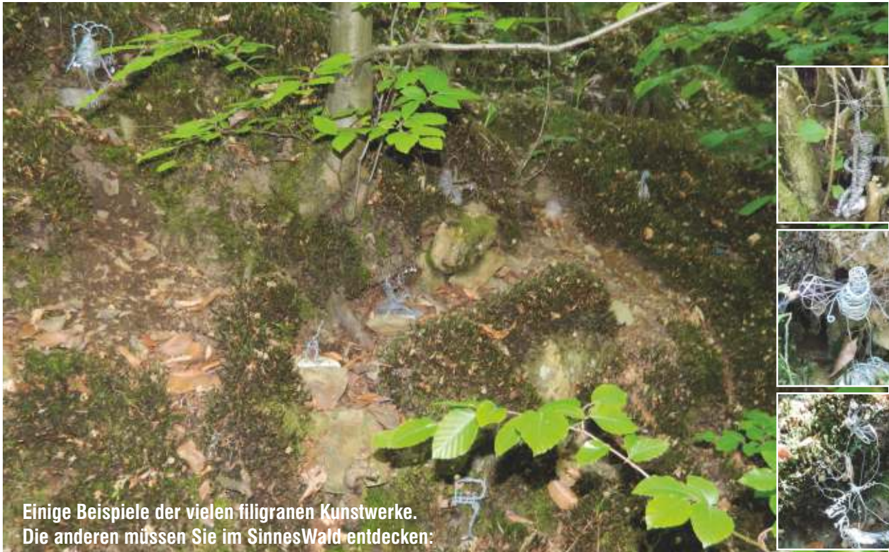
Einige Beispiele der vielen filigranen Kunstwerke. Die anderen müssen Sie im SinnesWald entdecken: