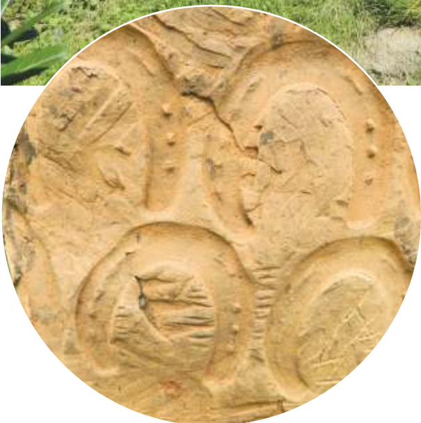
Terrakotta 1.250 Grad °C