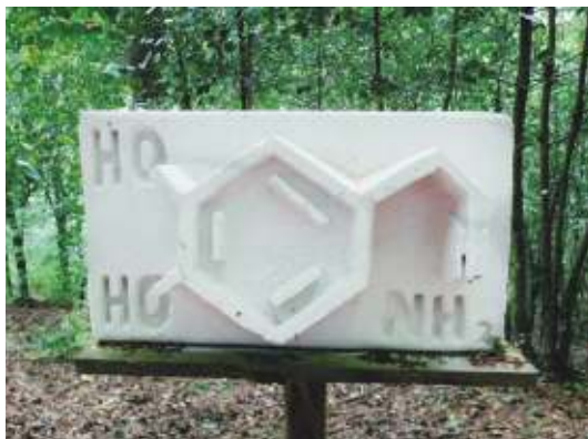
Lars Koch Glücksformel

Oftmals haben wir den Wunsch unser Glück für immer festzuhalten. Wir würden am liebsten in diesem schönen Moment für immer gefangen bleiben und ihn nie mehr loslassen. Nur was würde passieren, wenn wir das Glück wirklich festhalten könnten und würde es uns dann wirklich glücklicher machen?